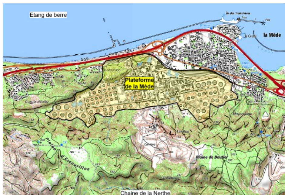
Figure 1: plan de situation.

La plateforme de la Mède (anciennement raffinerie de Provence) est implantée sur le territoire des communes de Châteauneuf-les-Martigues et de Martigues, sur le bord sud de l'étang de Berre.